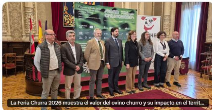
La Feria Churra 2026 muestra el valor del ovino churro y su impacto en el territ...

La Feria Churra 2026 muestra el valor del ovino churro y su impacto en el territorio cadenaser.com/castillayleon/... a través de @SERPalencia @RazaChurra