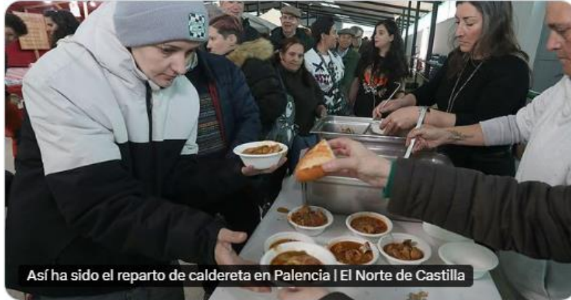
Así ha sido el reparto de caldereta en Palencia | El Norte de Castilla

Así ha sido el reparto de caldereta en la feria de raza churra en #Palencia