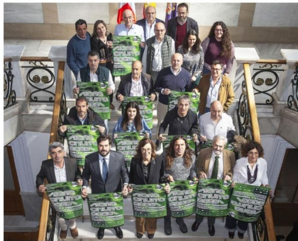
Foto de familia de organizadores, patrocinadores y colaboradores de la Feria Churra.

Martín incidió en que «las ovejas autóctonas en pastoreo hacen un trabajo fundamental para el territorio», y en este sentido señaló que «prevenimos incendios, cuidamos los montes, mantenemos el paisaje y aumentamos la biodiversidad. Somos ganaderos, pero también gestores del medio ambiente, y ese trabajo merece ser reconocido». Asimismo, subrayó la importancia de la innovación para garantizar el futuro de las explotaciones, y es que «trabajar con una raza autóctona no está reñido