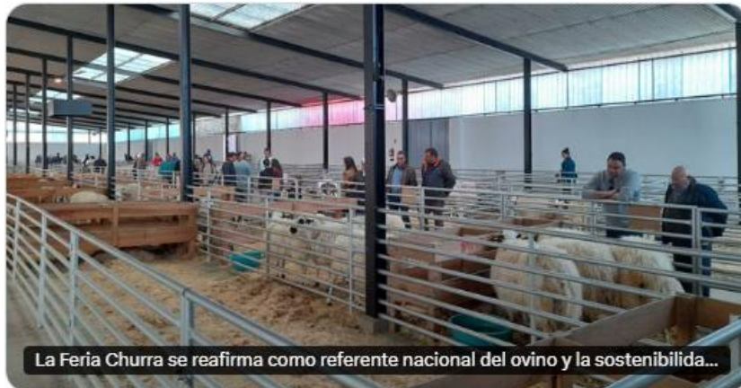
La Feria Churra se reafirma como referente nacional del ovino y la sostenibilidad...

La Feria Churra se reafirma como referente nacional del ovino y la sostenibilidad rural tras congregar a casi 5.000 personas