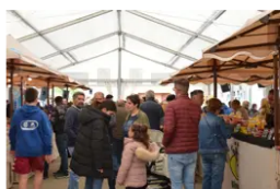
Asistentes de diversas edades concurren al punto de encuentro comercial de la Feria Churra. - FERIA CHURRA