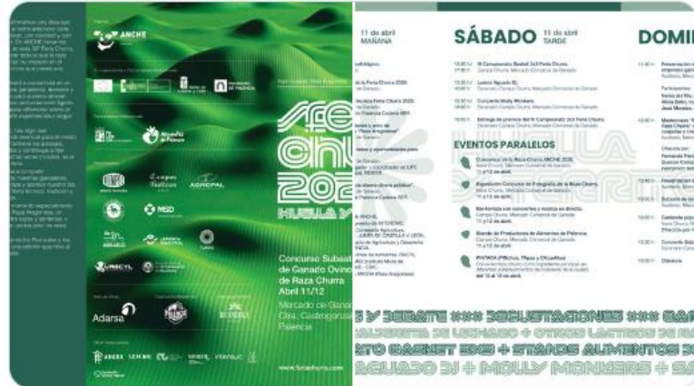
Tú y Dinutación de Palencia