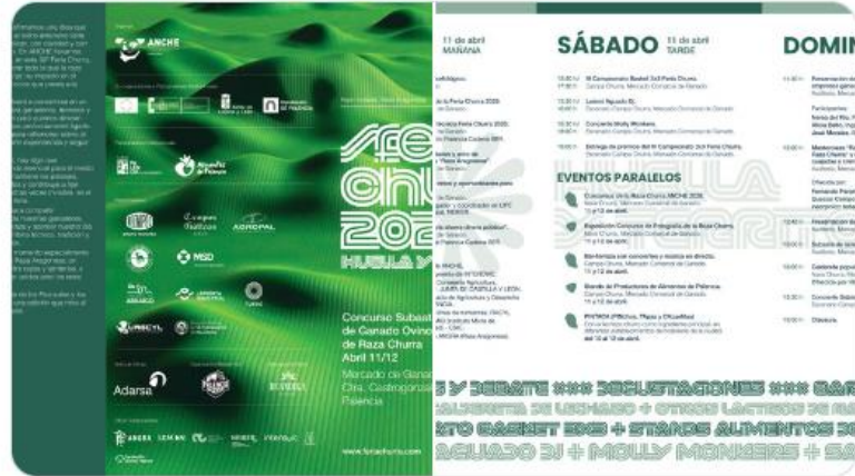
Tú y Dinutación de Palencia