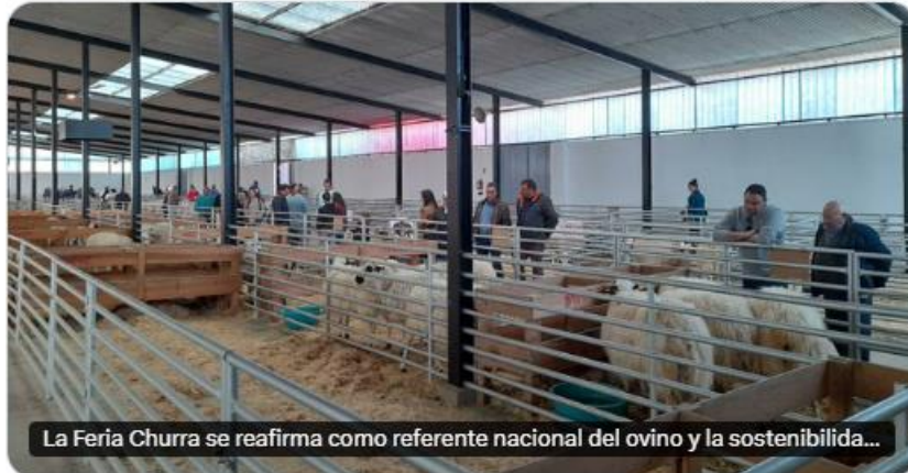
La Feria Churra se reafirma como referente nacional del ovino y la sostenibilidad...

La Feria Churra se reafirma como referente nacional del ovino y la sostenibilidad rural tras congregar a casi 5.000 personas